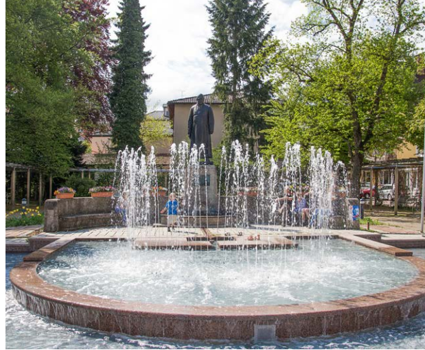
Bad Wörishofen, Brunnen und Denkmal für Pfr. Sebastian Kneipp

„Haltet mir meine Lehre rein“, meinte Sebastian Kneipp schon zu seinen Lebzeiten und begründete den Ruhm seiner Heimatstadt Bad Wörishofen als Pilgerort für Menschen,