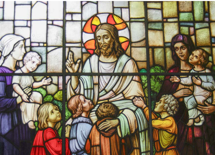
Der segnende Christus Jesus

Aufmunternde und mitfühlende Worte sind eine